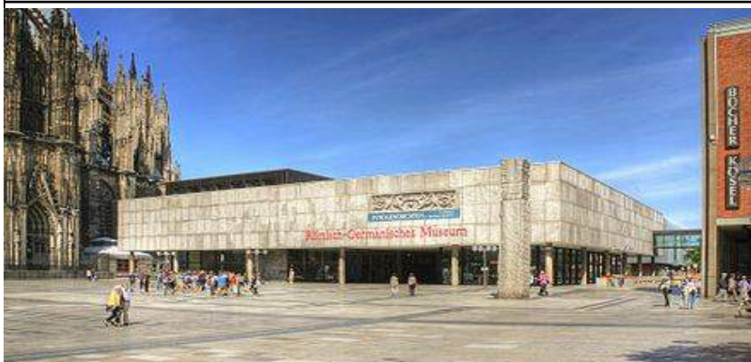
Musée romain germanique