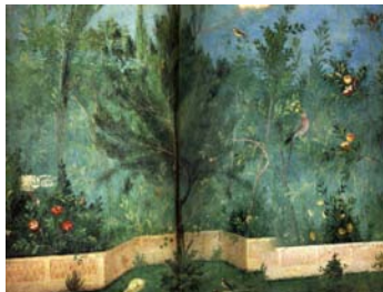
Une partie d'une fresque de sa maison.

La société décorative « Iniuriam Oculus » propose de créer chez vous des fresques en trompe-l'œil. Amorius, un riche Romain, a demandé à ce que toute sa maison de vacances de Misène soit décorée en trompe l'œil.