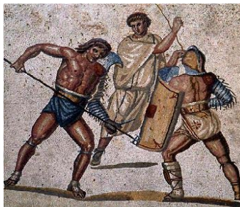
Le laniste de l'école Centrius.

En raison des tragiques événements qui viennent de se dérouler à Pompéi, le spectacle de gladiateurs prévu dans l'amphithéâtre de la cité, recouvert comme le reste par des mètres de cendres, n'aura pas lieu. Il est reporté aux ides d'octobre et se tiendra dans la petite ville de Nuceria. Au programme, le défilé habituel des combattants, puis des rétiaires, des mirmillons, dont le célèbre Polycarpès. Le spectacle se terminera par un combat d'ours. Venez nombreux!